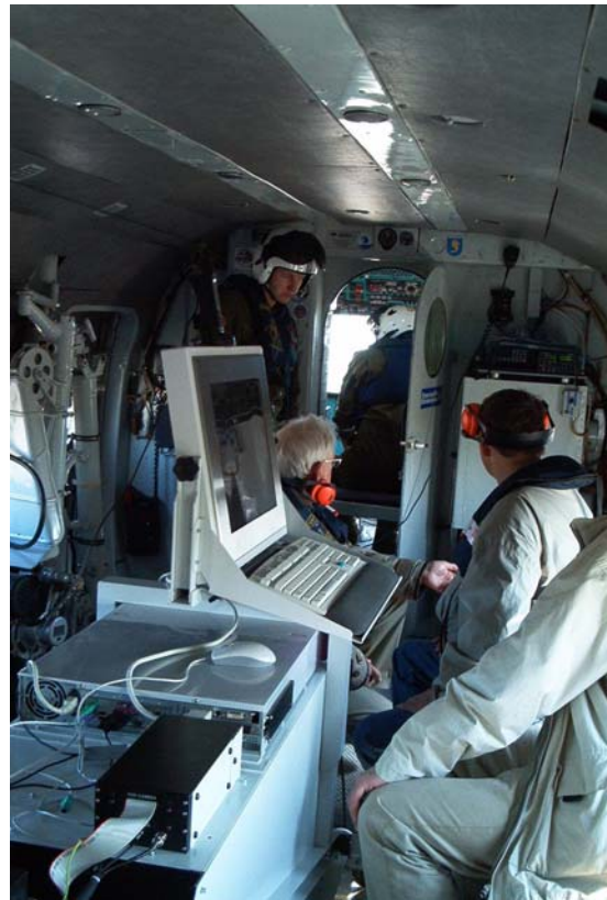
LDI lidar monitoorimas merd läbi lennukipõranda.