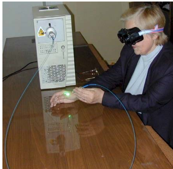
Raviotstarbeline Cu-laser FIs.

TÜ füüsikaosakonna eksperimentaalfüüsika ja tehnoloogia instituudi gaaslahenduslaboris uuritakse, võiks öelda, välku kodustatud-kontrollitud tingi-