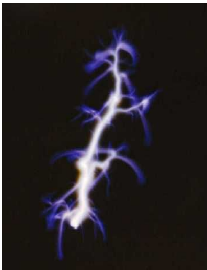
Kõrgsageduslahendus (20 MHz) laboratooriumiõhus.

Kuid gaaslahenduse töörühmale tuleb tähelepanu pöörata veel ühel, globaalse energeetika kriitilisest arengutest lähtuval erilisel põhjusel. Nimelt valitses maailmas 1950–60ndatel plasmafüüsikute